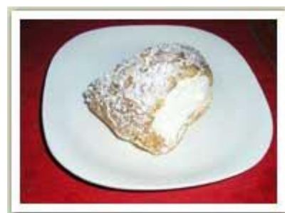
Glasswienerbröden hör till favoriterna. Inte på något annat ställe smakar de som på LB's.